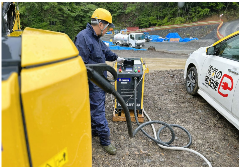
【MESTA Gen（右）と充電器（中央）を用いて電動ミニショベル PC30E-6（左）に充電をしている様子】

*1 : - GX 建機の現場運用拡大に向けたゼロエミッション給電ソリューションの推進 - ベルエナジーとコマツ、移動式給電車「MESTA Gen」により バッテリー式電動油圧ショベル 6 機種への給電を実証 | ニュースルーム | コマツ 企業サイト