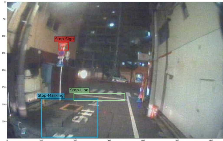
図 1：一時停止すべきことを指定する道路標識など

約 2,000 件の映像から、本アルゴリズムを用いて、本事象と判断される映像を抽出したところ、96%の精度（適合率 *5 ）で検知することに成功しました。（図 1）（図 2）